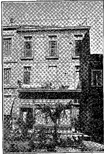
ΤΟ ΓΡΑΦΕΙΟΝ ΤΗΣ ΔΙΑΠΛΑΣΙΣ...